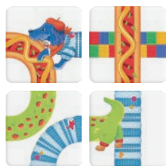
96 kartoników z jamnikami